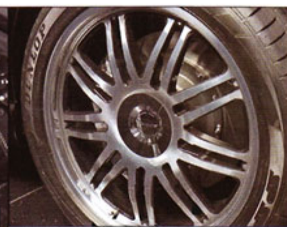
Кованые диски уменьшают неподдрессоренные массы.