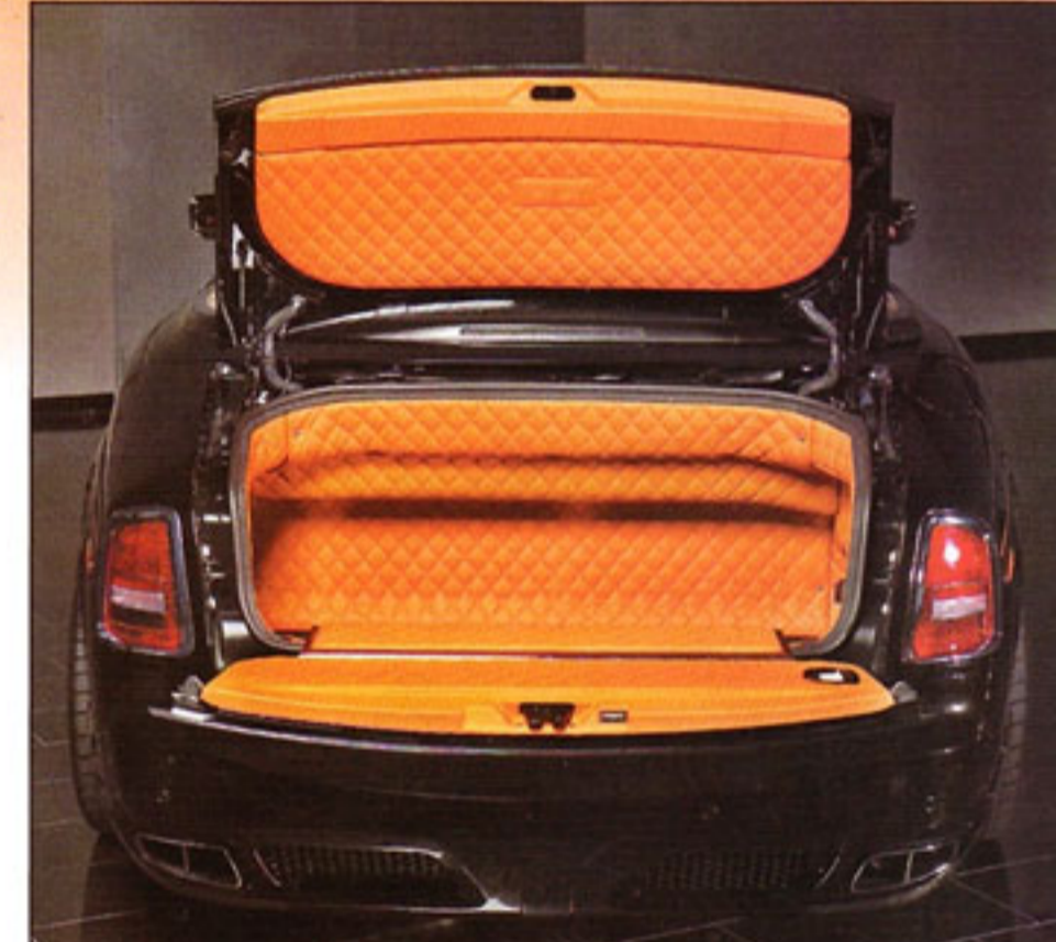
Создатели не оставили без внимания даже багажный отсек Drophead Coupe. По качеству отделки он не уступает салону стандартного RR.