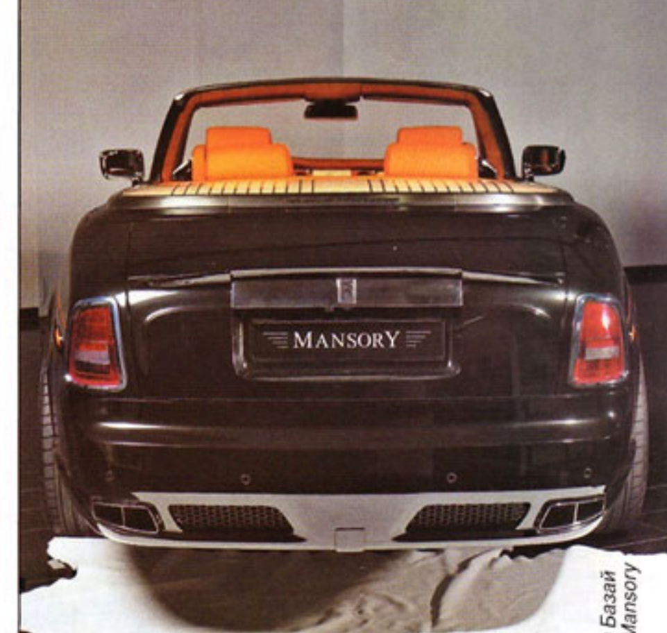
Роман Базай