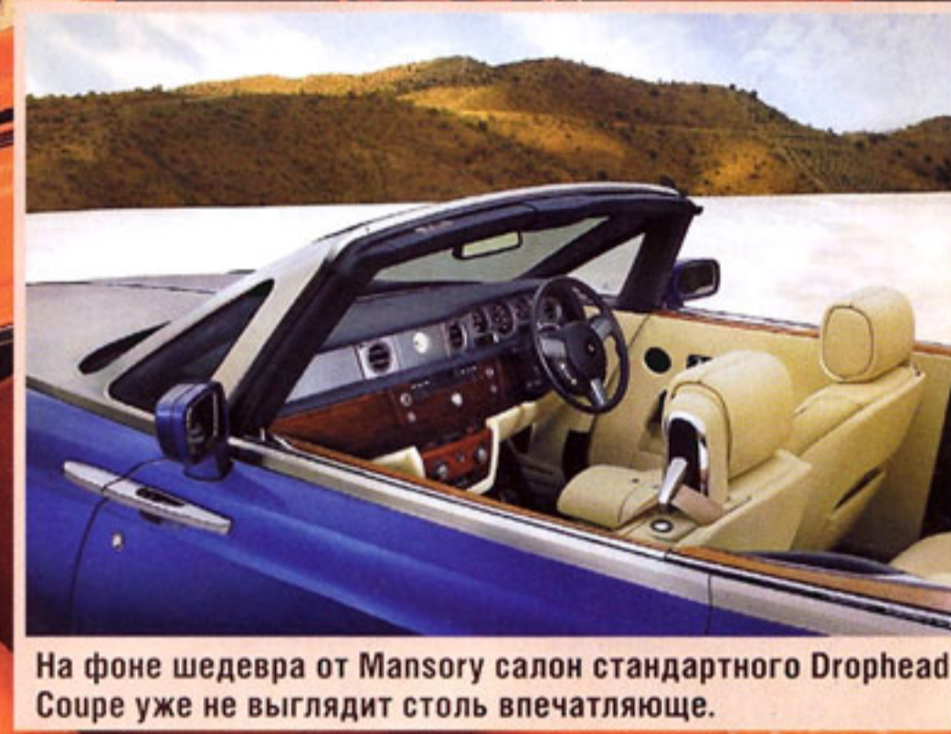
На фоне шедевра от Mansory салон стандартного Drophead Coupe уже не выглядит столь впечатляюще.