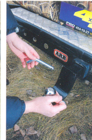
Всего пара движений – и пикап превращается в тягач для прицепа