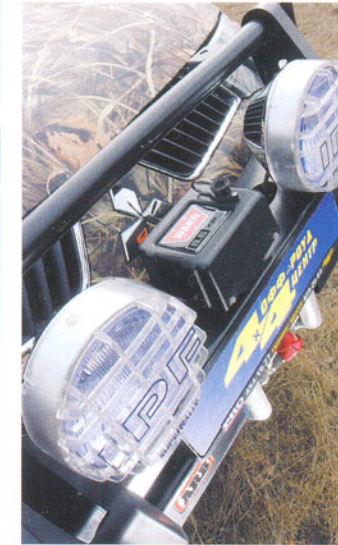
Мощная оптика и лебедка гармонично дополняют переднюю защиту ARB