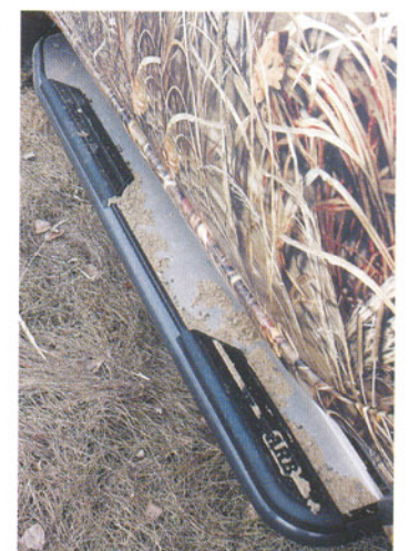
Защитные пороги облегчают посадку в «подпрыгнувший» пикап