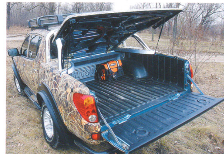
В багажном отсеке появилась пластиковая ванна и усиленная крышка. При необходимости она демонтируется в считанные минуты