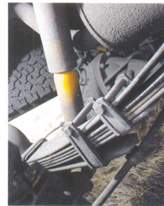
Задняя подвеска получила усиленные рессоры и амортизаторы