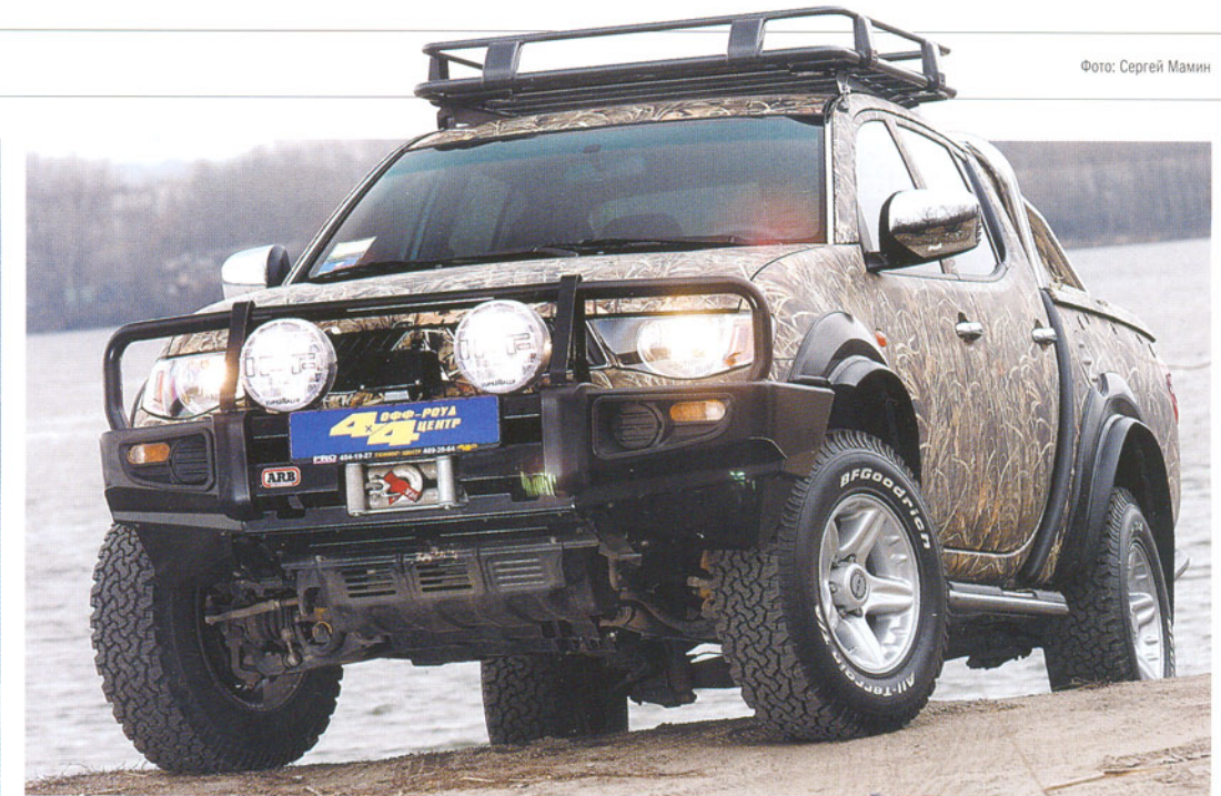
Спецмаскировка: камуфляжная пленка не только для красоты, она защищает кузов от царапин и влаги