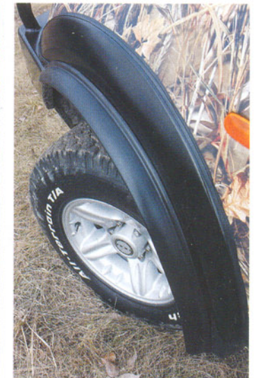
Нестандартные шины потребовали установки двойных расширителей