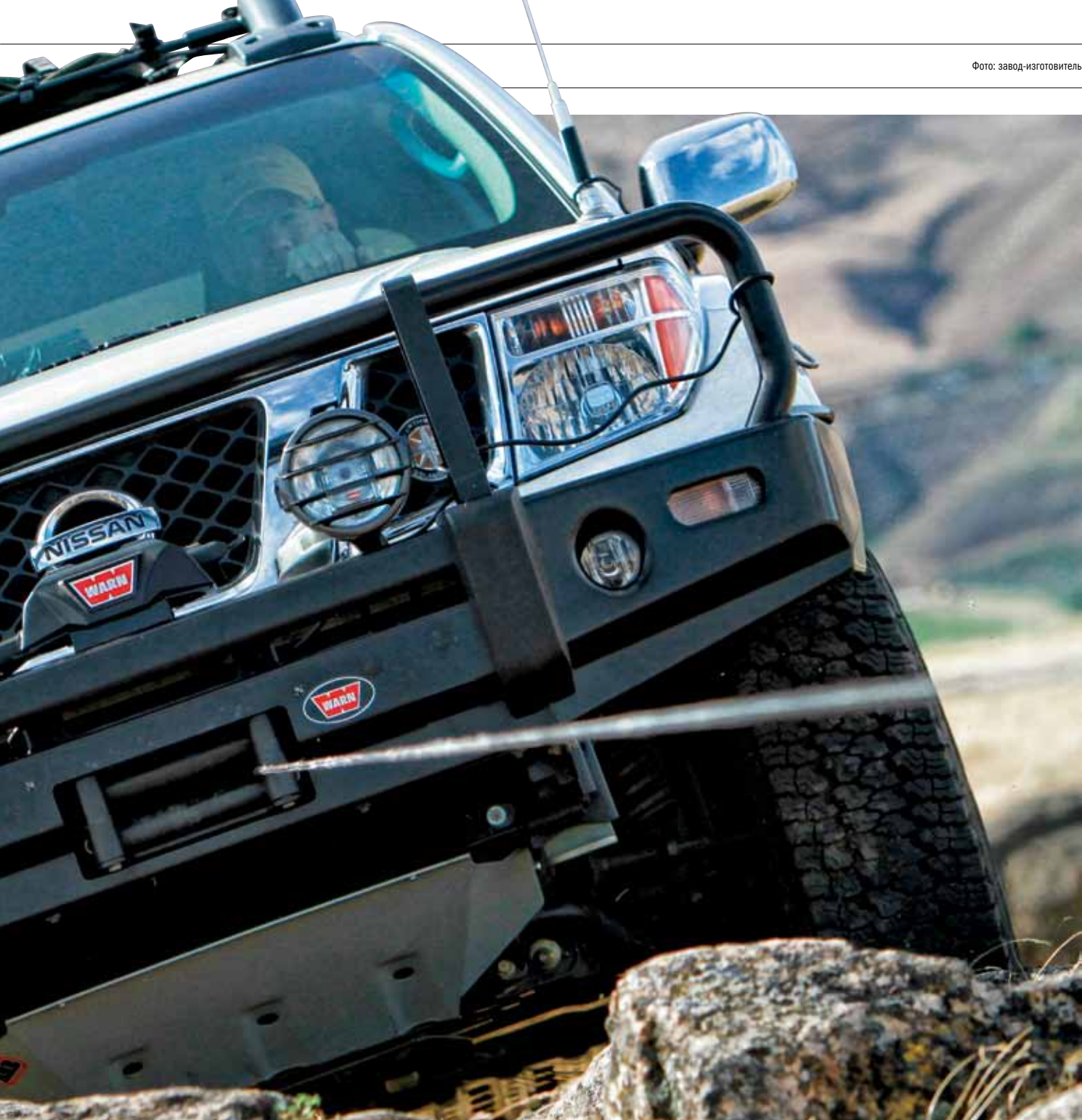
Редакция благодарит за предоставленные материалы компанию «4x4 Офф-Роуд Центр»

маршруту. Поэтому не стоит в экстремальных ситуациях прибегать к помощи «шедевров» безымянного слесарного творчества – отдайте предпочтение именитому производителю и спокойно отправляйтесь в путь. Тем более что компания WARN, мировой лидер в производстве лебедок, выпустила следующее поколение лебедок для внедорожников – серию Zeon.