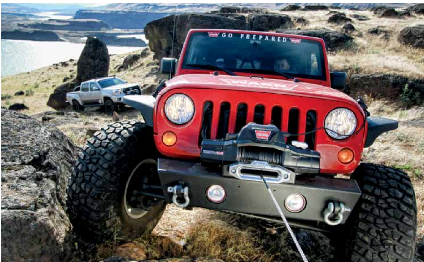
Буксировка невозможна: только надежная лебедка позволит вытащить тяжелый внедорожник из ловушки, которую он не смог преодолеть своим ходом

Новая серия выдержана в одном стиле, имеет повышенную эффективность, герметичность и стойкость к коррозии. Кроме того, лебедки устанавливаются в стандартные монтажные места, что облегчает процесс инсталляции