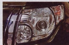
Сетчатое забрало радиаторной решетки и контурные накладки на фарах придают «лицу» выразительности