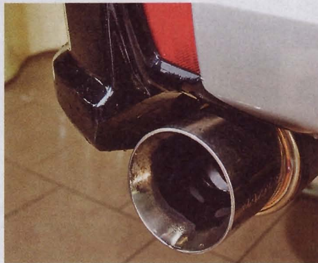
Минимальный хромированный декор приукрашивает аскетичный облик черного рыцаря