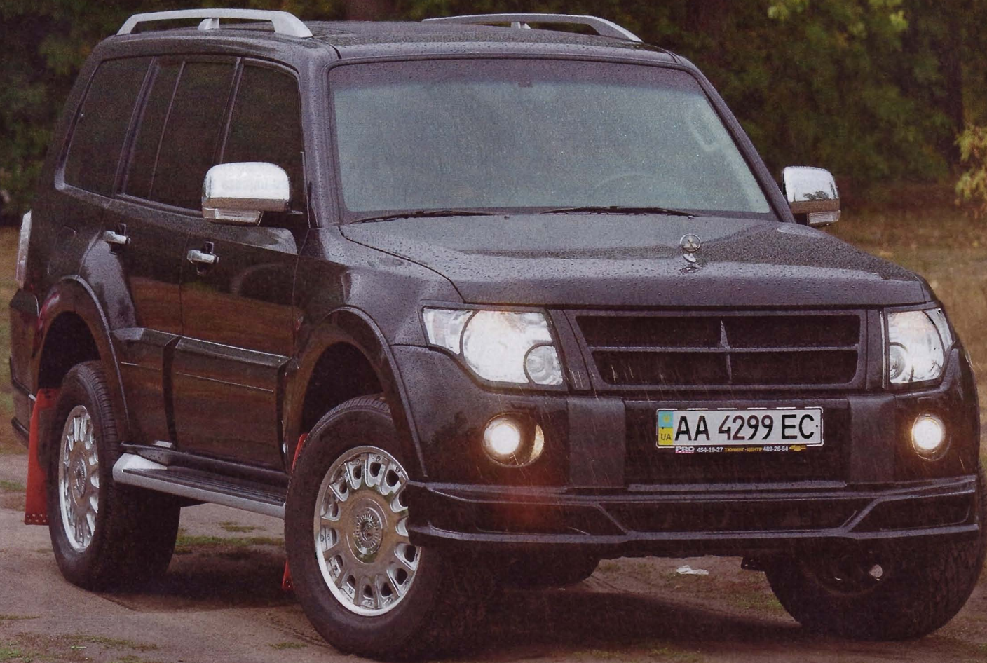
Массивному внедорожнику идеально подходит строгий рыцарский облик