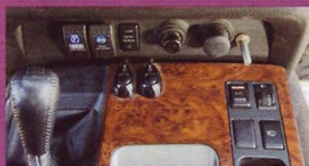
Блокировка переднего дифференциала, установленный под капотом компрессор и вся дополнительная оптика включаются из салона