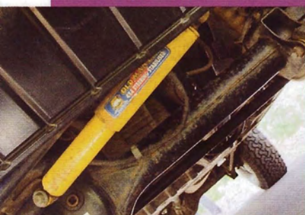
Подвеску, как и демпфер рулевого управления, полностью заменили на усиленную с лифтом 7,5 см