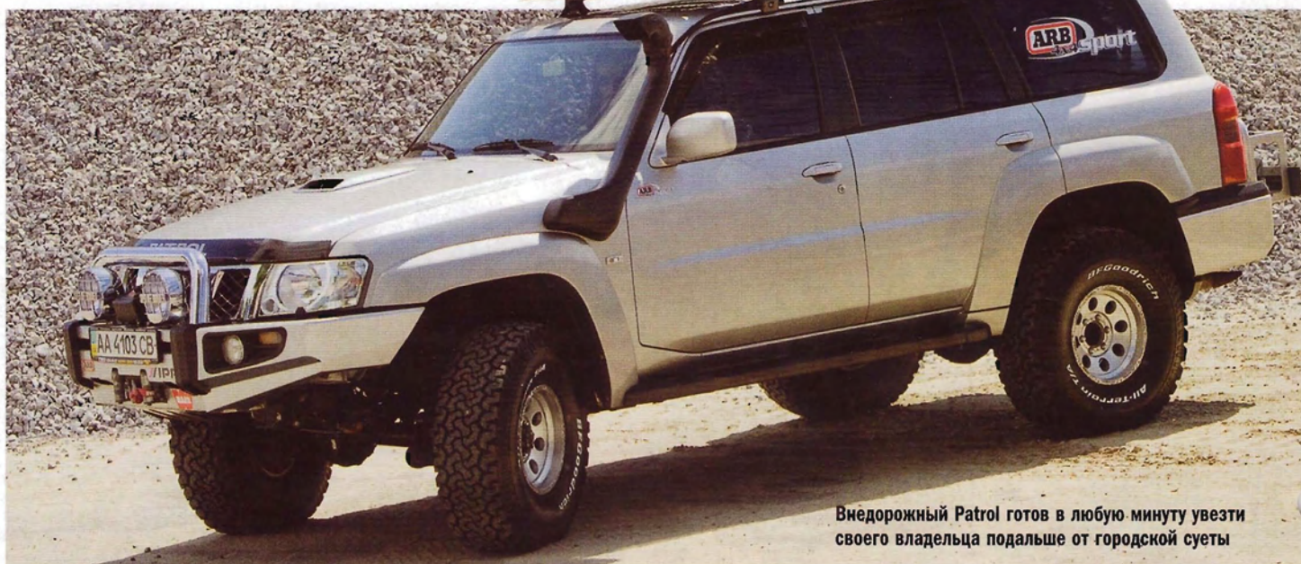
Внедорожный Patrol готов в любую минуту увезти своего владельца подальше от городской суеты