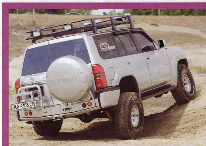
Скрещивание мостов и диагональное вывешивание игрушки

визуально выделяют автомобиль в городском потоке: с ними уже ни у кого не возникает сомнений в том, что это «действующий» внедорожник.