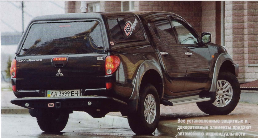
Все установленные защитные и декоративные элементы придают автомобилю индивидуальности