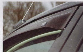
Дефлекторы на окнах позволяют проветривать салон даже в дождливую погоду. Заднее стекло - под ключ