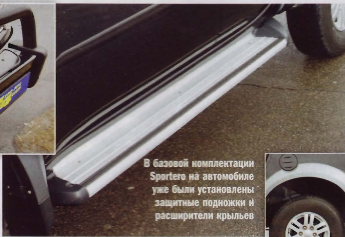
В базовой комплектации Sportero на автомобиле уже были установлены защитные подножки и расширители крыльев

крышку-канопи производства ARB, тем самым превратив пикап в идеальный транспорт для любой погоды. Надстройка имеет сдвижные тонированные боковые окна и стеклянную крышку сзади, которую можно открыть отдельно, например, для загрузки мелочей. Встроенные замки позволяют обезопасить груз, ведь закрытая верхняя часть блокирует открывание заднего борта. Благодаря раздвижному окну между кабиной и канопи кузов пикапа может стать от-