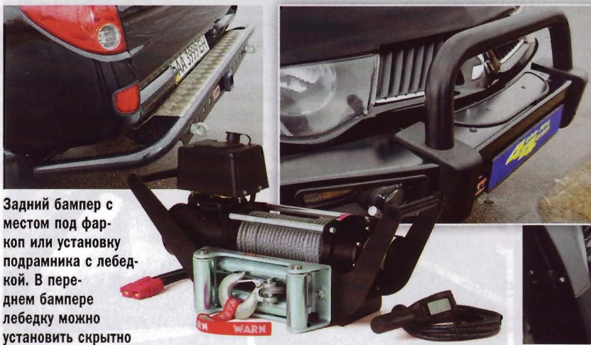
Задний бампер с местом под фаркоп или установку подрамника с лебедкой. В переднем бампере лебедку можно установить скрытно