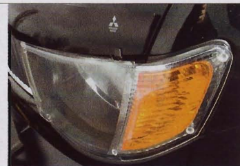
Пластиковые накладки защищают оптику и капот от повреждений