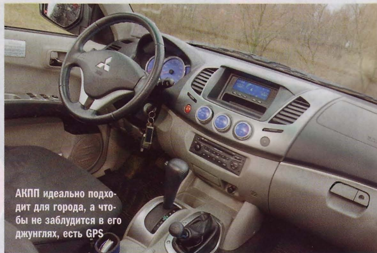
АКПП идеально подходит для города, а чтобы не заблудится в его джунглях, есть GPS

Владелец, выбирая автомобиль для городской эксплуатации, предпочел L200 в богатой заводской комплектации Sportero. Для тянучек и заторов прекрасно подходит его 4-ступенчатая автоматическая коробка передач, базовые подножки облегчают посадку в высокий автомобиль, а расширители крыльев выполняют не только декоративную функцию, но и защищают кузов от грязи. Но и это далеко не предел, ведь для индивидуализации автомобиля в нем многое пришлось усовершенствовать.