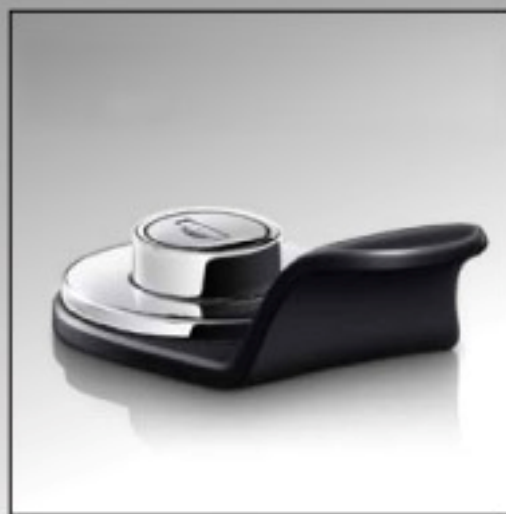
Одноточечная блокирующая система