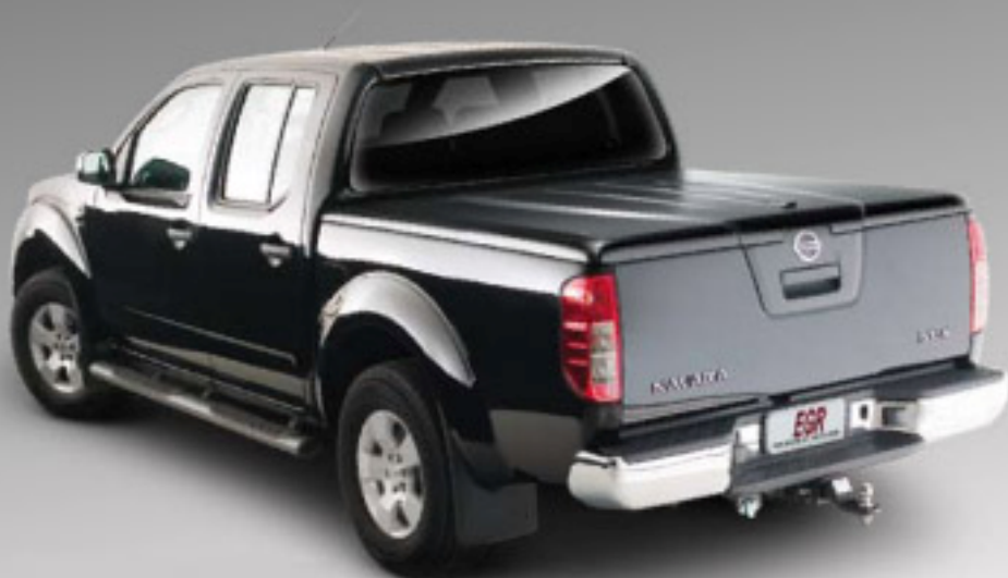
Крышка багажного отсека