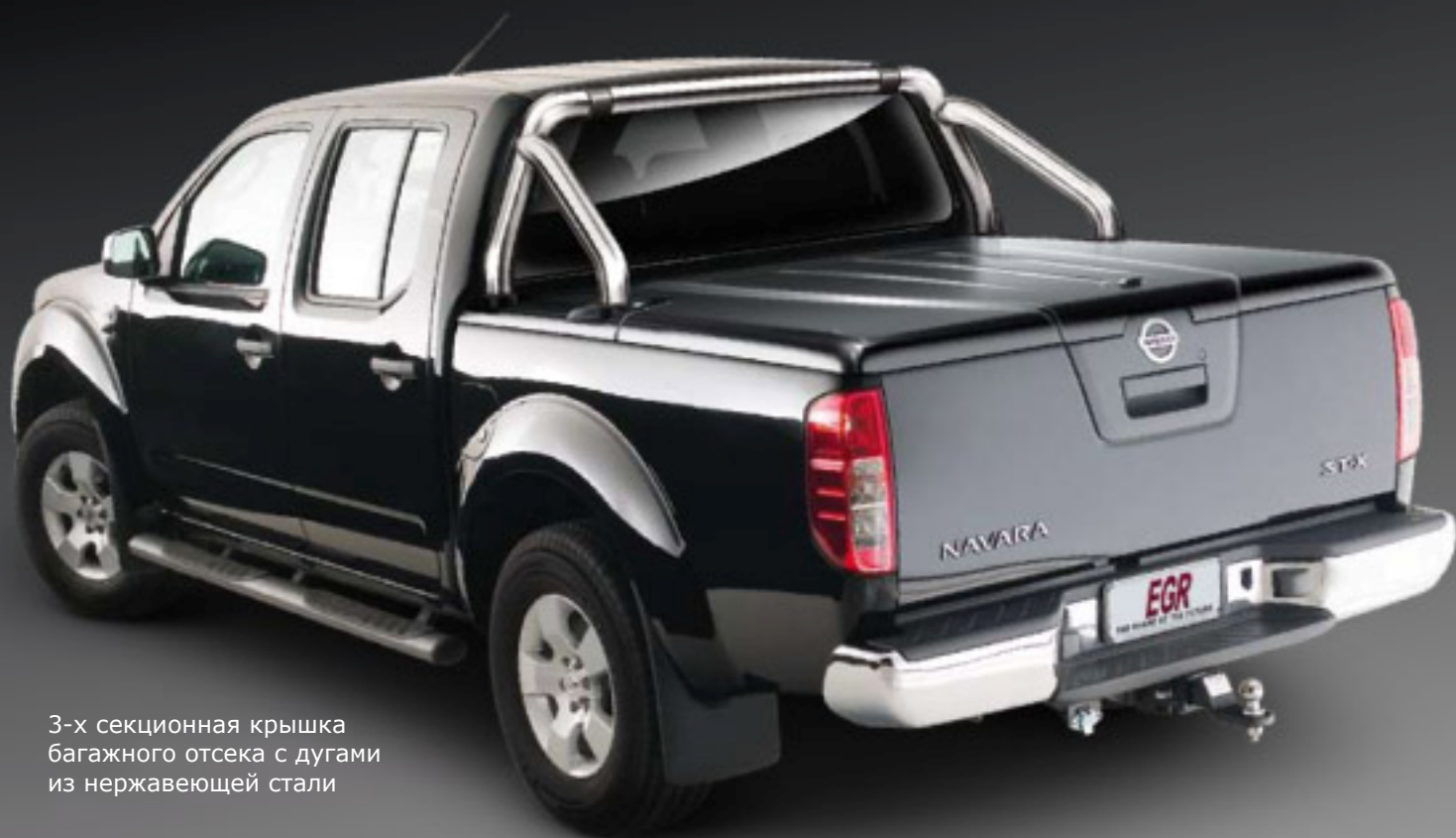
3-х секционная крышка багажного отсека с дугами из нержавеющей стали