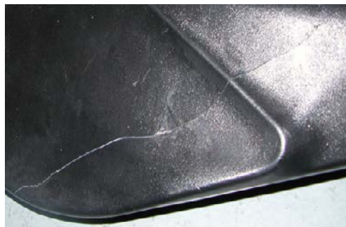
Механическое повреждение – треснувший от удара корпус китайского шноркеля на фото. На оригинальном шноркеле Safari останется лишь царапина.

Проще говоря, низкокачественные китайские копии шноркелей не могут обеспечить безупречного качества, высоких характеристик и долговечности, которыми владельцы шноркелей Safari дорожат уже на протяжении последних трех десятков лет. Кроме низкой стоимости, нет ни одного другого повода для приобретения китайских подделок.