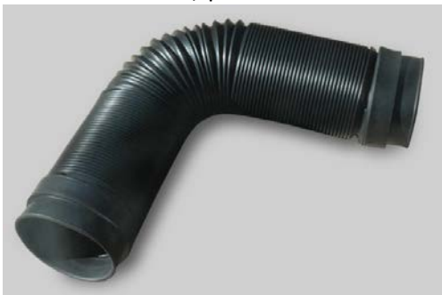
Пластик, из которого сделаны патрубки, не предназначен для использования при высоких температурах